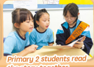
Primary 2 students read the story together