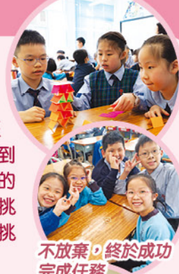
不放棄，終於成功完成任務

整個活動中，學生積極投入，勇於分享個人經歷，互相鼓勵，展現出堅毅與自信，更從中領悟出擁有積極心態的重要性，亦懂得在逆境中尋求成長的機會。