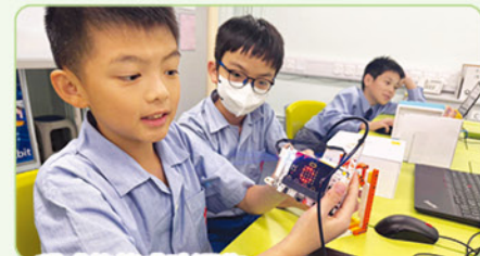
程式能夠成功運作