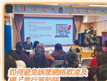
如何避免誤墮網絡欺凌及網上罪行等陷阱