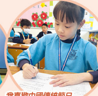
我喜歡中國傳統節日