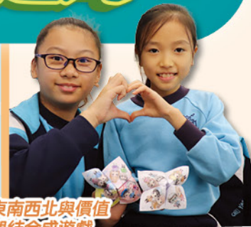
東南西北與價值觀結合成遊戲