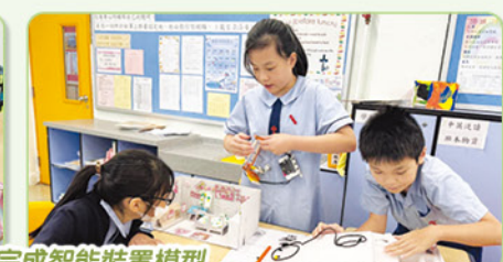
四年級同學認真聽五年級同學介紹產品