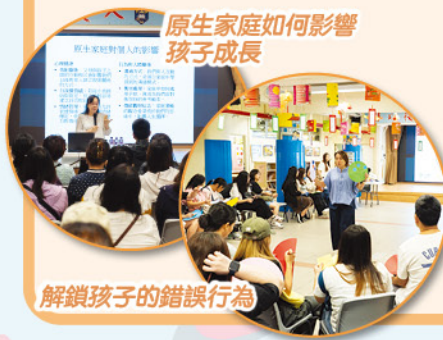
原生家庭如何影響孩子成長