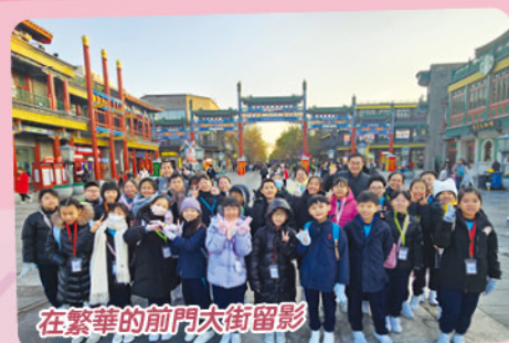
在繁華的前門大街留影

這次北京交流豐富了學生們對國家歷史文化的認識，激發他們對作為中國人的自豪感及對國家未來的承擔精神，獲益良多。