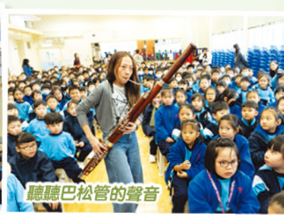
聽聽巴松管的聲音