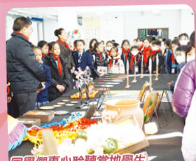
同學們專心聆聽當地學生介紹藝術作品