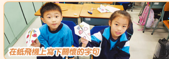
在紙飛機上寫下關懷的字句

視藝科活動把傳統兒時玩意配合價值觀讓學生感受手作小玩意的樂趣，三年級同學透過製作紙飛機，學生不僅能學習摺紙技巧，還能探索物理學的基本原則，如重力和空氣阻力。這個活動可以鼓勵學生進行比賽，並在過程中感受成功的喜悅和團隊合作的價值。四年級同學透過摺東南西北，培養學生的方向感和團隊合作能力，加強他們的觀察和思考能力。五年級同學在熊貓摺紙活動，引發同學對環保和動物保護的關注。