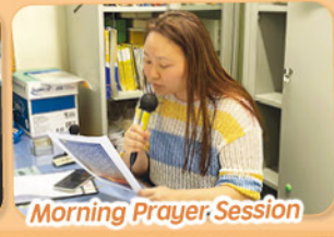
Morning Prayer Session