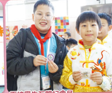
兩校學生互贈紀念品