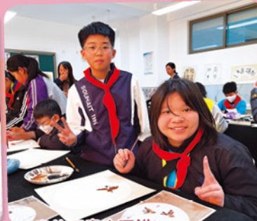
我畫的國畫也不錯