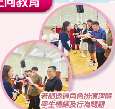
老師透過角色扮演理解學生情緒及行為問題

工作坊透過體驗式學習及小組互動，以輕鬆、愉快活動形式，啟發老師不單使用「頭腦」去學習，更透過自我的「心靈」去體驗正向教養的理念及技巧，讓老師們理解學生之情緒及行為問題上之深層需要，尋求長期而有效的解決方法。同時，掌握在教育學生之途徑上必修「心法」及「技巧法」。