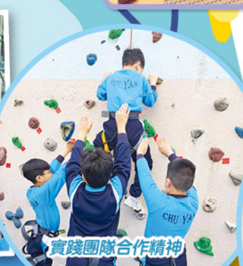
實踐團隊合作精神