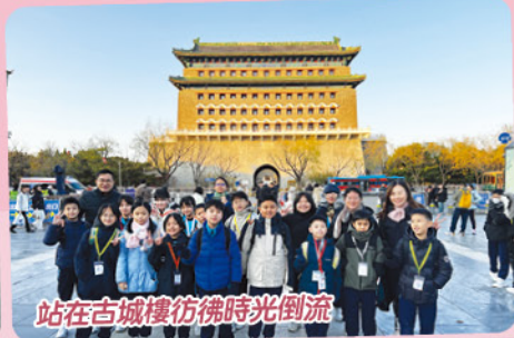
站在古城樓彷彿時光倒流