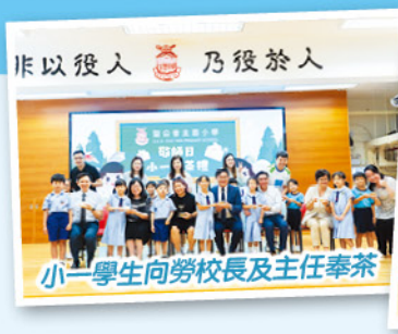
小一學生向勞校長及主任奉茶

為了培養學生從小尊敬師長，善事長輩、父母及懂得感恩孝道的美德，本校在10月8日舉行小一奉茶禮，當天誠邀一年級家長出席有關活動，接受子女奉茶。希望透過活動提醒教師和學生「敬師愛生」和弘揚師道的精神。