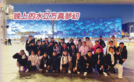
晚上的水立方真夢幻