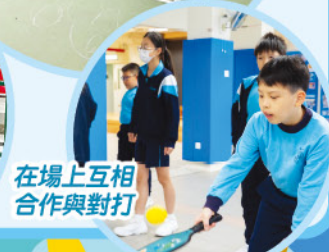
在場上互相合作與對打