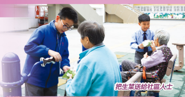
把生菜送給社區人士