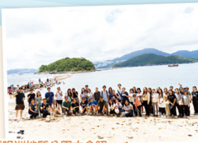
橋咀洲地質公園大合照

10月6日的教師專業發展日，活動為「西貢生態考察團」。當日參觀鹽田梓客家文化及香港二級歷史建築的教堂；到橋咀洲地質公園進行考察，認識岩石的種類和地貌特徵。透過考察活動，教師能探討文化保育與教育的連結，為建立跨學科課程提供教學靈感，推動校本課程創新。