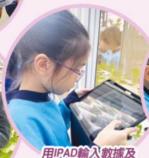
用IPAD輸入數據及拍照紀錄生長情況

本年度小四的水耕種植專題研習是一次結合圖書、電腦、視覺藝術、科學科和服務學習的跨學科STEAM活動。同學們從研習中，學會運用閱讀策略搜集資料、學習水耕和土耕的知識，運用編程製作測光器，學會定植和量度植物的生長情況，並分析不同濃度營養液對水耕植物的影響，把生菜包裝送給社區人士。在這次專題研習中，他們能靈活運用不同知識和技能完成專題任務。