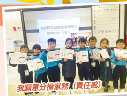
我願意分擔家務(責任感)

為了培養學生正面價值觀，在主恩樂趣周的中文活動中融入價值觀教育。透過生活化的題材，運用「知、情、行」三部曲，讓學生感受、體驗和實踐，逐漸建立正確的價值觀。使學生在未來的生活中能做一個正向、盡責、仁愛、守法的好公民。