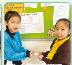
朋友之間互相送贈心意卡