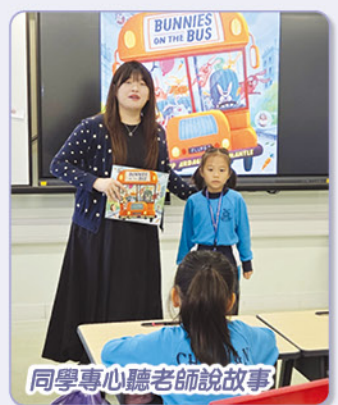
同學專心聽老師說故事

老師們在早讀時段與學生分享不同的優質繪本，激發學生閱讀的樂趣，提升語言及閱讀的能力。