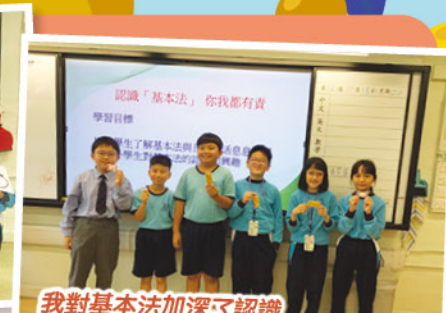
我對基本法加深了認識