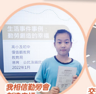
我相信勤勞會創造幸福