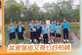
其實落雨又有乜好怕喎