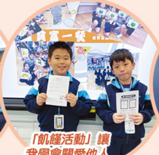
「飢饉活動」讓我學會關愛他人