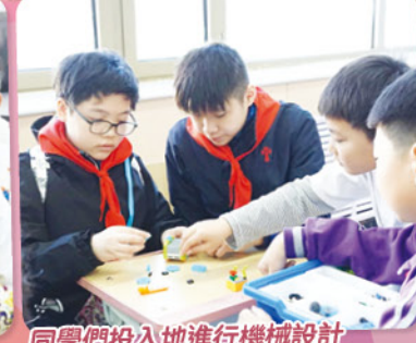
同學們投入地進行機械設計