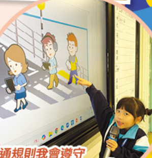
交通規則我會遵守