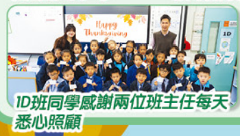
1D班同學感謝兩位班主任每天悉心照顧