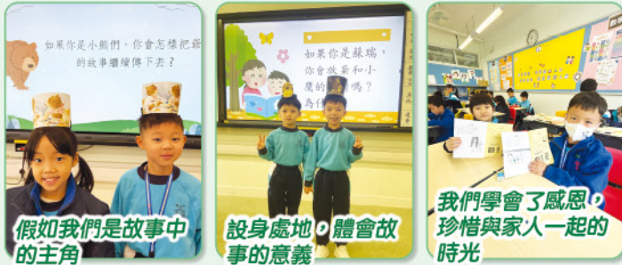
假如我們是故事中的主角

整個過程中，同學表現出高度的參與熱誠，認真思考故事背後的人生教訓，並將課題連結至日常生活，展現出對感恩、尊敬等正向價值的深刻認識，並承諾在日後從生活中作實踐。