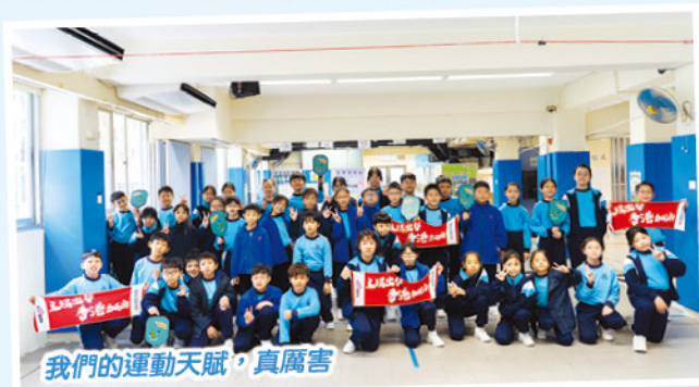
我們的運動天賦，真厲害

體育科為同學提供新興運動(手綿球及匹克球)體驗，培養他們對體藝活動的興趣。促進同學之間的團結精神，並建立健康生活方式。