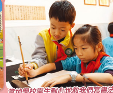
當地學校學生耐心地教我們寫書法