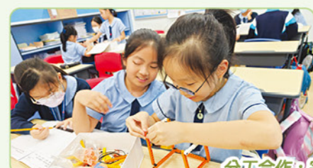
分工合作，完成智能裝置模型

本年度小五的智能生活專題研習是一次結合中文、圖書、電腦、視覺藝術和常識科的跨學科STEAM活動。同學們從研習中，學會運用閱讀策略搜集資料、設計家居模型，運用編程和各種感應器，製作符合生活需求的智能家居裝置。在這次專題研習中，他們不但能靈活運用編程技能，還認識和實踐「設計循環」概念。