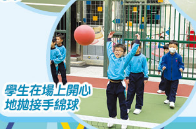
學生在場上開心地拋接手綿球