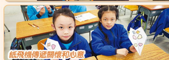
紙飛機傳遞關懷和心意