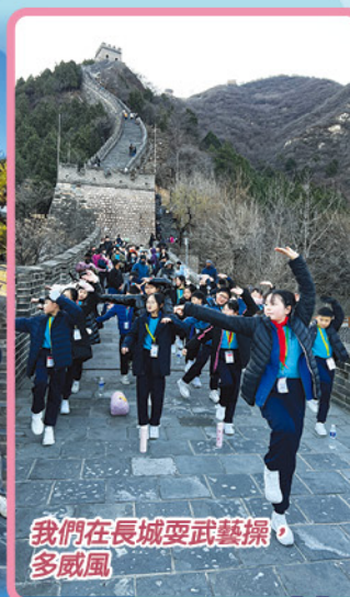
我們在長城耍武藝操多威風