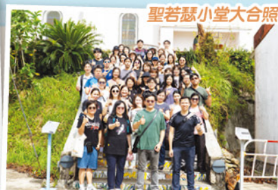
聖若瑟小堂大合照