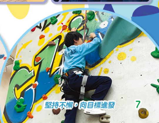
堅持不懈，向目標進發