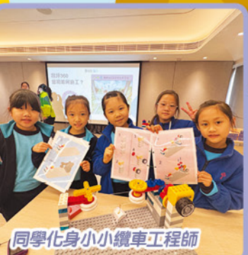
同學化身小小纜車工程師