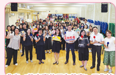
參與《教室裏的正向教育》工作坊