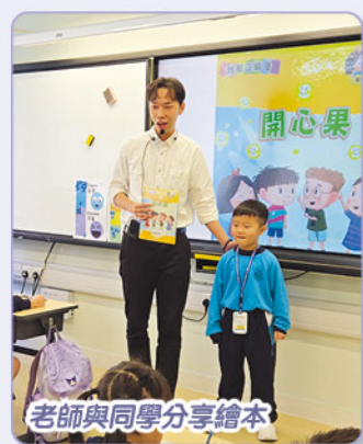
老師與同學分享繪本