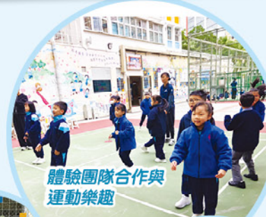
體驗團隊合作與運動樂趣