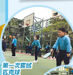
第一次嘗試匹克球