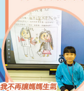
我不再讓媽媽生氣