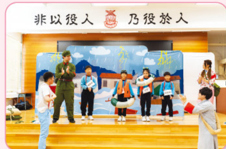
同學們一起參與互動環節