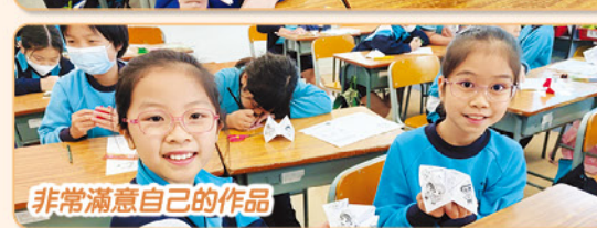
非常滿意自己的作品