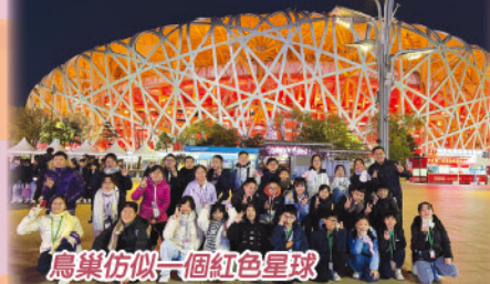
鳥巢仿似一個紅色星球