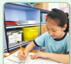
同學用心寫上祝福和感謝的字句

學校舉辦「Thanksgiving 活動」，透過填寫心意卡及贈送活動，將自己的恩典施予別人，學習常存感恩。