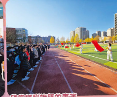
欣賞精彩旗舞的表演