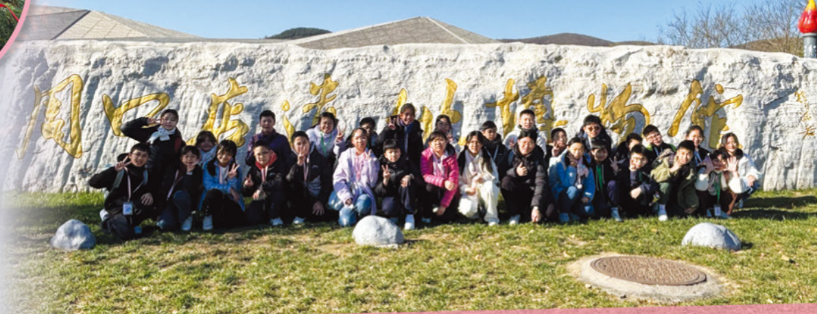
周口店博物館前留影