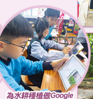
為水耕種植做Google Slides簡報