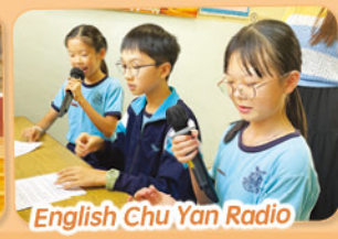
English Chu Yan Radio