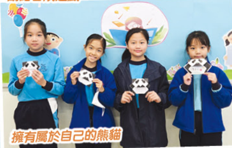
擁有屬於自己的熊貓

視藝科活動把傳統兒時玩意配合價值觀讓學生感受手作小玩意的樂趣，三年級同學透過製作紙飛機，學生不僅能學習摺紙技巧，還能探索物理學的基本原則，如重力和空氣阻力。這個活動可以鼓勵學生進行比賽，並在過程中感受成功的喜悅和團隊合作的價值。四年級同學透過摺東南西北，培養學生的方向感和團隊合作能力，加強他們的觀察和思考能力。五年級同學在熊貓摺紙活動，引發同學對環保和動物保護的關注。