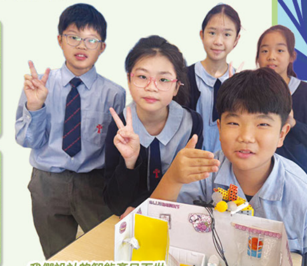
我們設計的智能產品面世