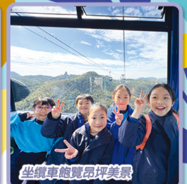
坐纜車飽覽昂坪美景