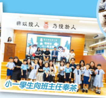
小一學生向班主任奉茶