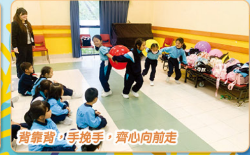
背靠背，手挽手，齊心向前走