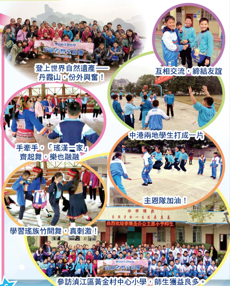
登上世界自然遺產——丹霞山，份外興奮！