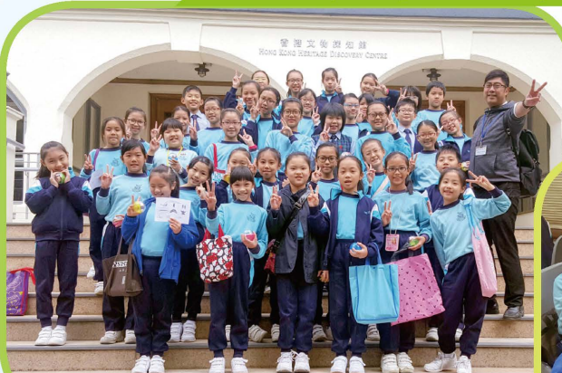
同學跳出課室，走到社區認識更多不同的藝術文化