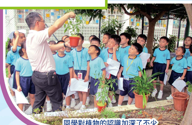
同學對植物的認識加深了不少