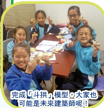
完成「斗拱」模型，大家也可能是未來建築師呢！