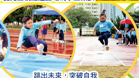
跳出未來，突破自我