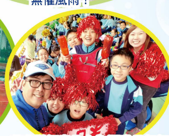
啦啦隊傾盡全力為運動員打氣