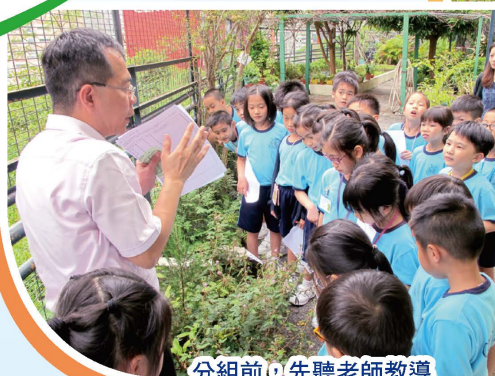
分組前，先聽老師教導