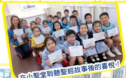
在小聖堂聆聽聖經故事後的喜悅！