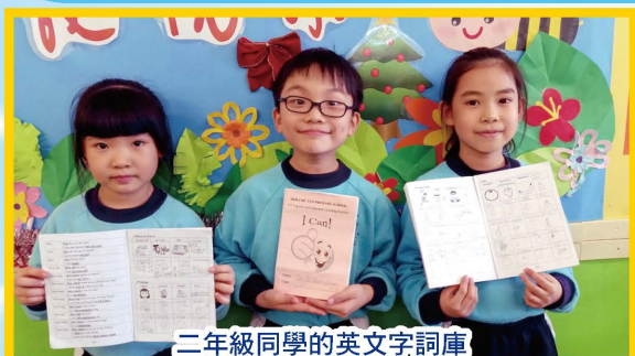
三年級同學的英文字詞庫