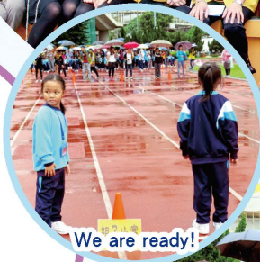
We are ready!