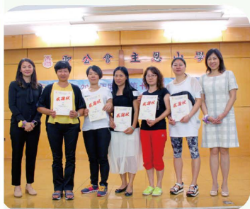
頒發家長義工感謝狀