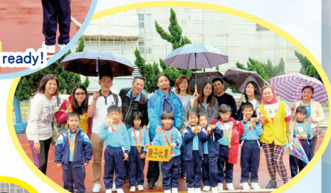
親子在雨中比賽樂也融融