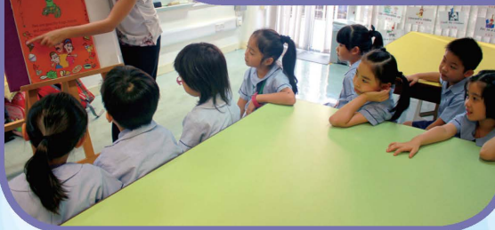
同學們耐心聆聽故事，投入活動