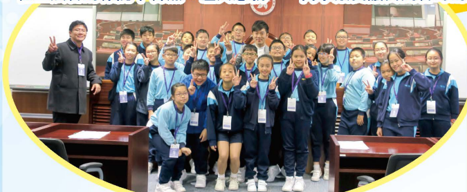
鄭松泰議員解答同學們的提問