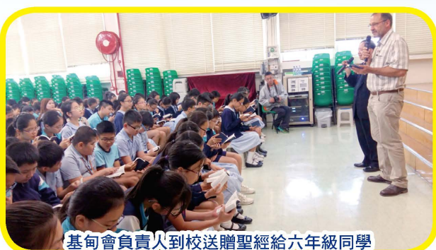
基甸會負責人到校送贈聖經給六年級同學