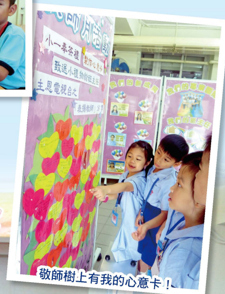
敬師樹上有我的心意卡！