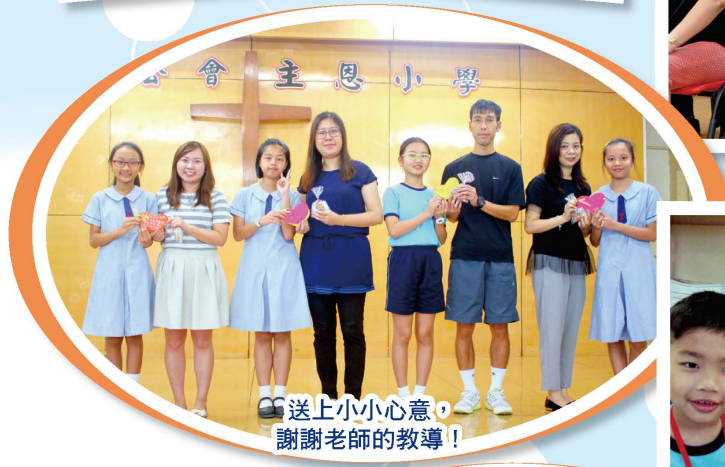
送上小小心意， 謝謝老師的教導！