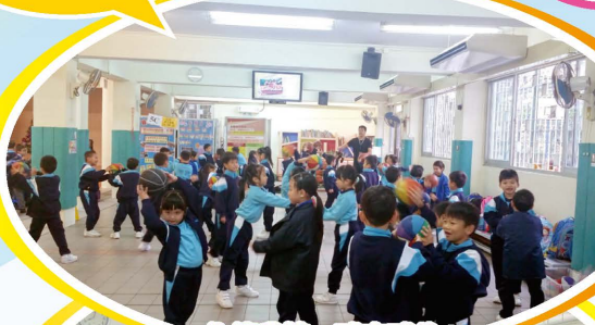
你傳我接，球來球往！

早上，一、二年級學生可參與早操活動，而三至六年級學生可參與晨跑活動。學生們積極參與，清晨回校伸伸手，彎彎腰，跑跑跳跳，完成健體活動後，人人精神抖擻，迎接新一天的學習。