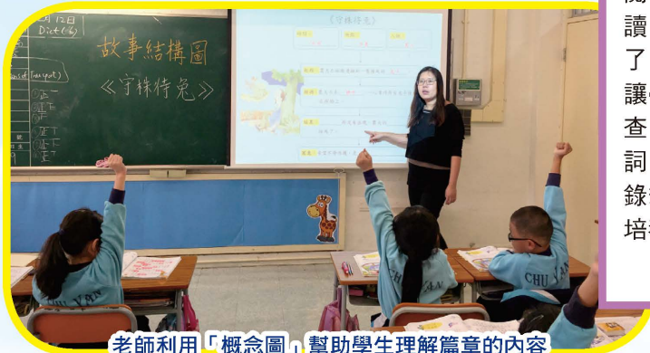
老師利用「概念圖」幫助學生理解篇章的內容

本年度中文科除重點訓練學生的閱讀策略、提升閱讀能力外，還印製了《自學筆記》，讓學生先預習課文，查找不懂的生字深詞，並在課堂上摘錄筆記以鞏固所學，培養自學的習慣。