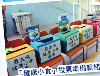
「健康小食」投票準備就緒