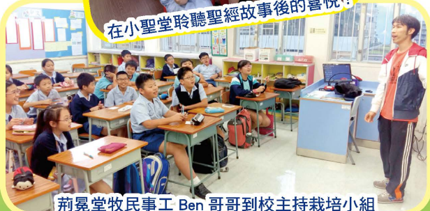
荊冕堂牧民事工 Ben 哥哥到校主持栽培小組