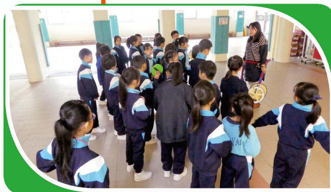
跳出課室進行「量度」活動