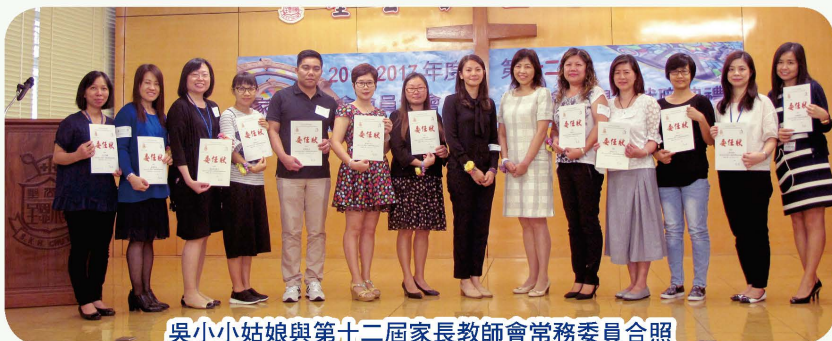
吳小小姑娘與第十二屆家長教師會常務委員合照