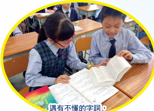
遇有不懂的字詞，我們會主動請教「啞老師」