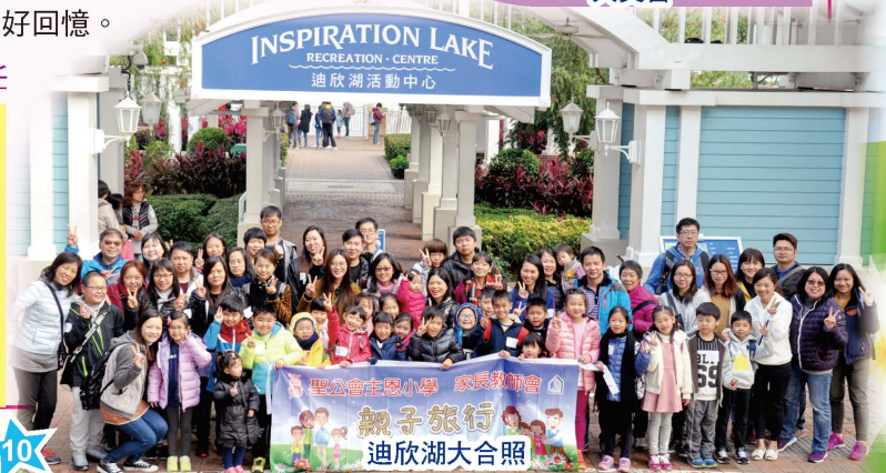
親子旅行 迪欣湖大合照