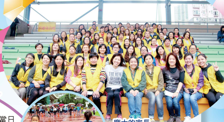
龐大的家長義工隊！