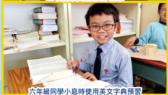
六年級同學小息時使用英文字典預習