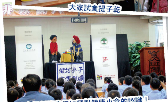
木偶劇讓我們加深對健康小食的認識！