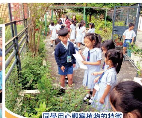
同學用心觀察植物的特徵