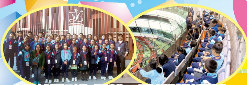
在立法會的標誌下合照，極具意義