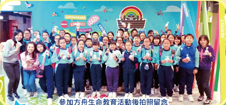
參加方舟生命教育活動後拍照留念