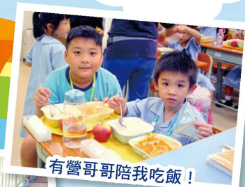
有營哥哥陪我吃飯！