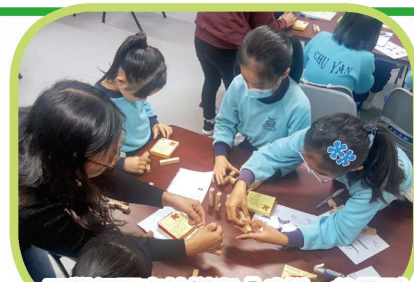
同學們認真地拼砌「斗拱」的模型