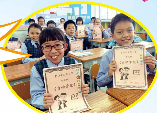
一枚枚的貼紙是老師對學生積極自學的嘉許