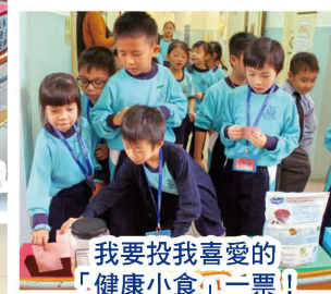
我要投我喜愛的「健康小食」一票！