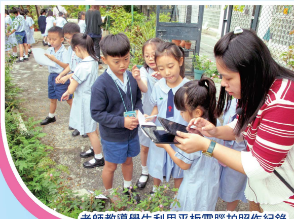
老師教導學生利用平板電腦拍照作紀錄