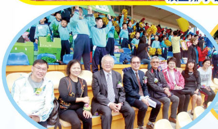
嘉賓們與啦啦隊一同為運動健兒打氣