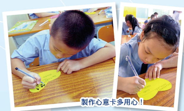
製作心意卡多用心！