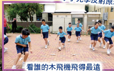
看誰的木飛機飛得最遠