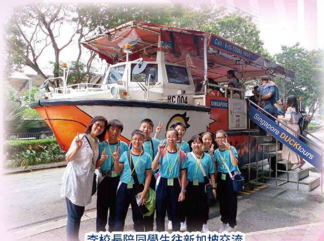
李校長陪同學生往新加坡交流

還記得我們今年的主題金句嗎？「上帝看着一切都甚好」，我們都是天父的精心傑作。我相信，只要大家有這樣的信心，在生命的進程中，依靠天父，願意努力朝着美善前進，「自主學習樂滿紛，欣賞生命頌主恩」，不會單是一句口號，而會成為我們生命的寫照。