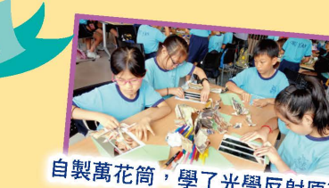
自製萬花筒，學了光學反射原理