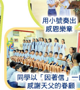
用小號奏出感恩樂章