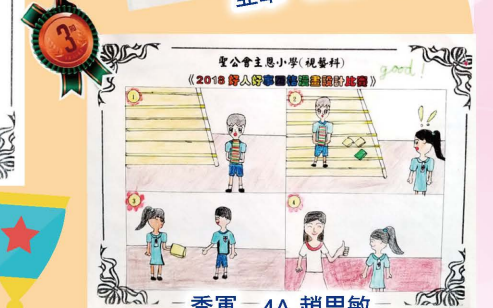
季軍 4A 趙思敏