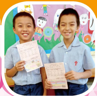
我欣賞自己的優點