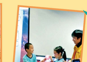
原來手拉是會通電的