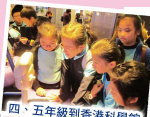
四、五年級到香港科學館