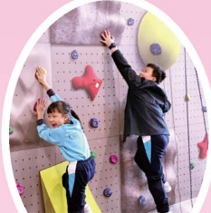
三年級到青衣西南體育館認識攀石活動，了解不同的運動設施