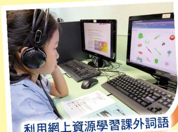
利用網上資源學習課外詞語