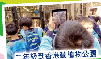
二年級到香港動植物公園