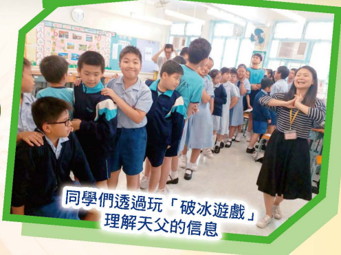
同學們透過玩「破冰遊戲」理解天父的信息