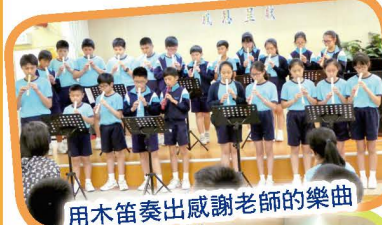
用木笛奏出感謝老師的樂曲