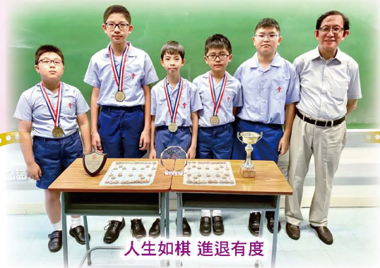
人生如棋 進退有度

很高興在教學生涯的尾聲當選「表揚教師」，成為晚宴最後的一道甜品。在主恩廿四載，得到同事在專業上的認同，格外顯得珍貴。韓愈師說有云：師者，所以傳道、受業、解惑也。回首往昔，如果我能夠做到上述三點，就肯定無負今生。