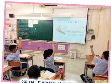
透過「課題推測法」，提升學生的思維能力及閱讀興趣