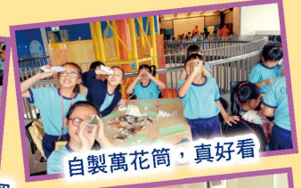
自製萬花筒，真好看