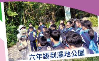
六年級到濕地公園