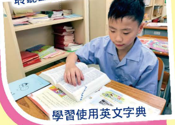
學習使用英文字典