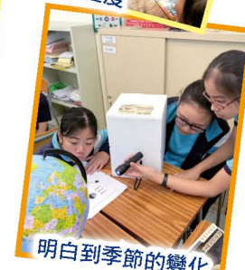
明白到季節的變化