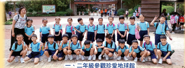
一、二年級參觀珍愛地球館