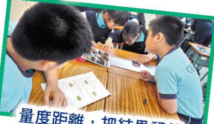
量度距離，把結果記錄