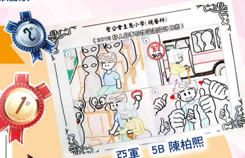
亞軍 5B 陳柏熙