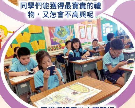
同學們認真地查閱聖經