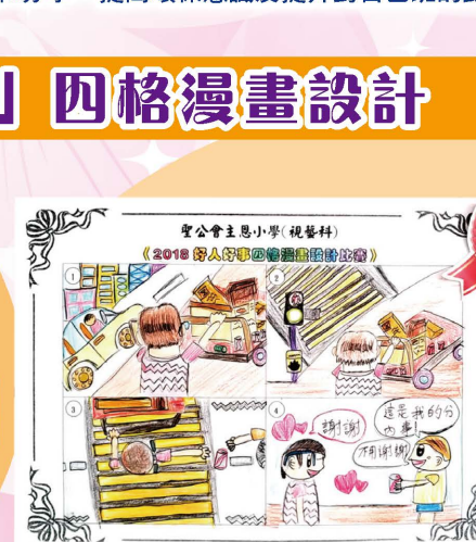
冠軍 4A 何焯謙