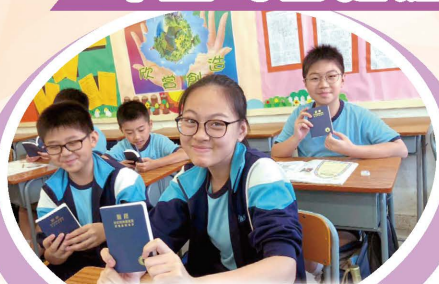
同學們能獲得最寶貴的禮物，又怎會不高興呢