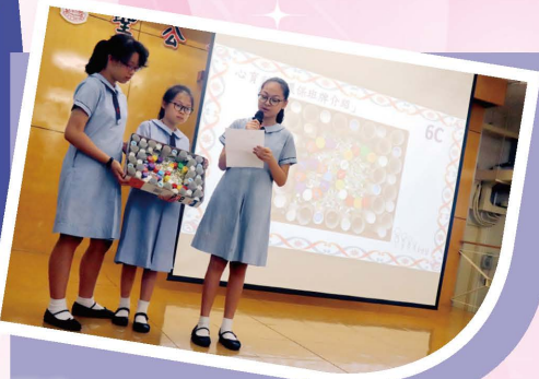
透過製作和分享，提高環保意識及提升對自己班的歸屬感