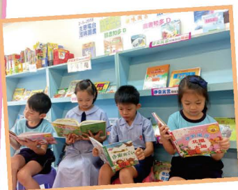
《伊索寓言》真吸引呢