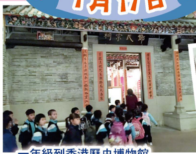
一年級到香港歷史博物館