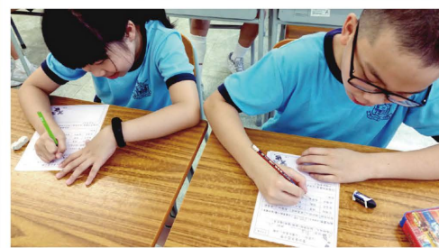
為同學寫下欣賞的說話，互動互勉