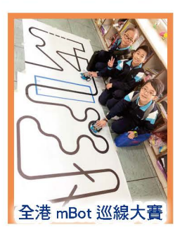
全港 mBot 巡線大賽