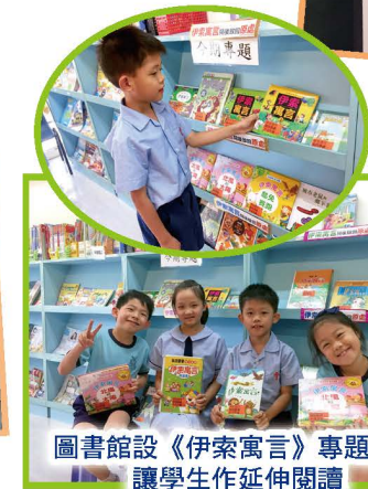
圖書館設《伊索寓言》專題區，讓學生作延伸閱讀