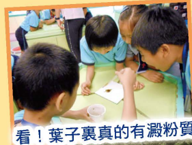
看！葉子裏真的有澱粉質