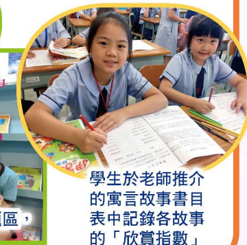
學生於老師推介的寓言故事書目中記錄各故事的「欣賞指數」