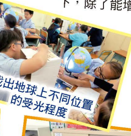
找出地球上不同位置的受光程度