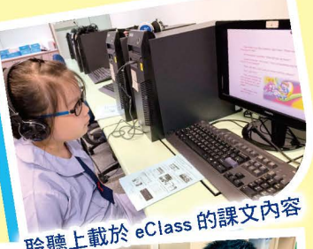
聆聽上載於 eClass 的課文內容