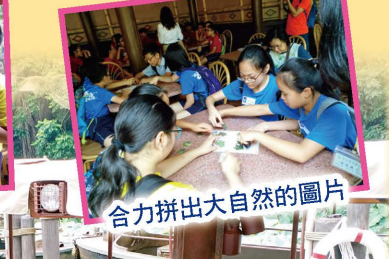
合力拼出大自然的圖片