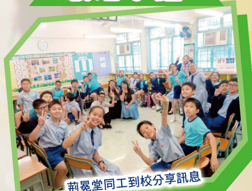
荊冕堂同工到校分享訊息