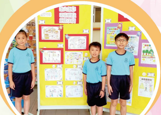
學生以四格漫畫元素，加上創意，繪畫出一個個動人故事，彰顯好人好事，傳遞正能量！