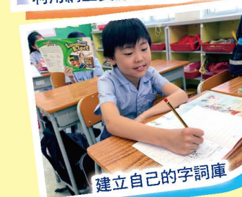
建立自己的字詞庫