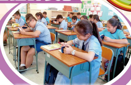
同學們專心聆聽如何查閱聖經