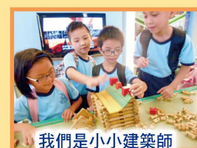
我們是小小建築師