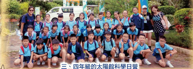
三、四年級的太陽館科學日營